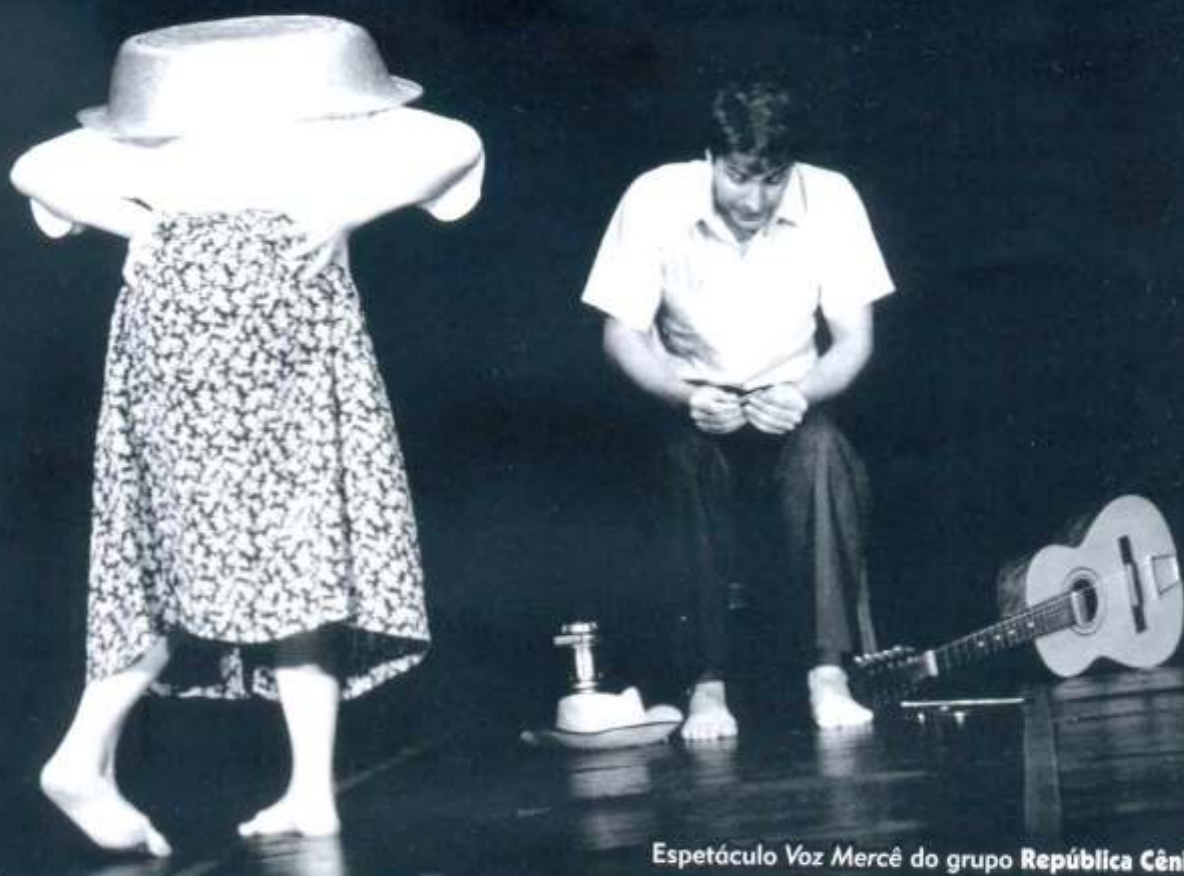
Espectáculo Voz Mercê do grupo República Cênica